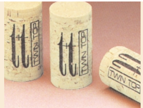
Twin Top® d'Amorim: des matériaux de qualité et une production de haute technologie.

Voici moins de deux ans, Amorim a également ouvert en Australie une nouvelle usine de fabrication de bouchons Twin Top® pour apporter une réponse mondiale à la demande de bouchons industriels.