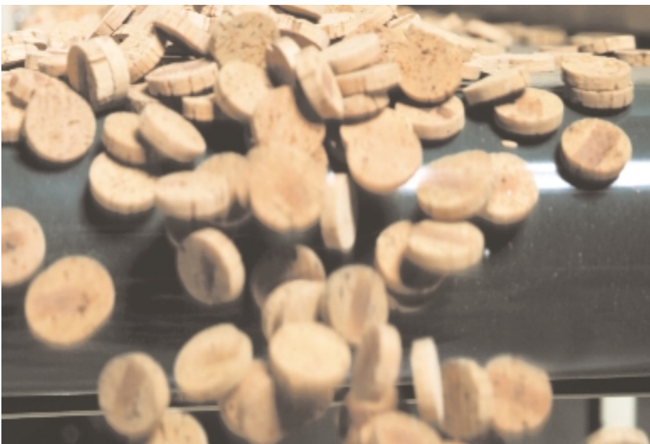
La forte demande mondiale pour ses bouchons Twin Top® a obligé Amorim à augmenter sa capacité de production.

Cette formule, qui a fait ses preuves, a permis au bouchon Twin Top® d'Amorim d'obtenir régulièrement d'excellents résultats au cours d'essais comparatifs sur les bouchons menés par de grands organismes de recherche en France, en Allemagne et en Australie.