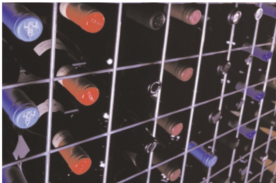
L'étude menée par l'institut australien de la recherche vinicole a démontré que les bouchons de liège naturel entiers et les bouchons Twin Top® étaient parmi les meilleurs après 18 et 24 mois d'entreposage.

Au stade des 24 mois, seulement six des 14 bouchons continuaient à conserver des niveaux de dioxyde de soufre adéquats. Sur ces six bouchons, quatre étaient de liège ou à base de liège.