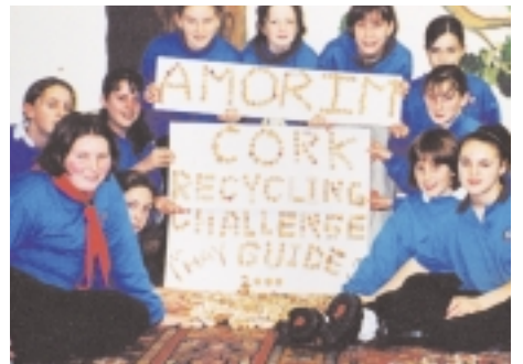
Les membres de la 1ère patrouille Hay on Wye Guide fêtent leurs exploits en matière de recyclage du liège.

Après avoir franchi la barre du million à la fin de l'année dernière, Amorim a proposé aux différentes patrouilles d'Eclaireurs un concours de photos pour marquer l'événement. De nombreuses photos ont été envoyées et la 1ère patrouille Hay on Wye a désigné le vainqueur.