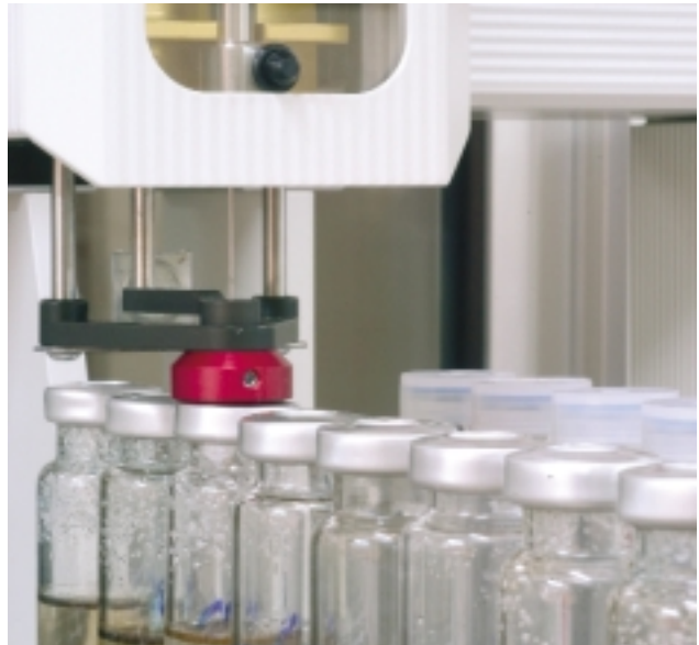
Eine der Hauptanstrengungen der Forschungs- und Entwicklungsarbeit hält an, da Amorim an der Anwendung des ROSA Verfahrens bei Naturkorken arbeitet.

Die Abfülltests werden weiterhin durchgeführt, obwohl es schon jetzt klar ist, dass die Behandlung mit ROSA das Risiko eines muffigen Geschmacks bei abgefüllten Weinen sehr stark verringert. Hierdurch wird sichergestellt, dass der Korken nach wie vor der beste Verschluss für Wein bleibt.